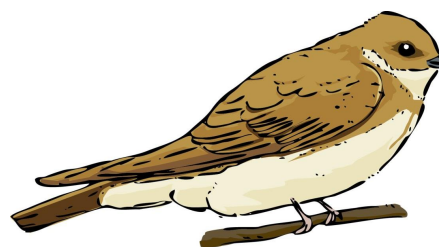
L'Hirondelle de rivage